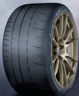
Eagle F1 SuperSport RS